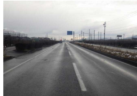
【Aから見た本件事故現場の状況】