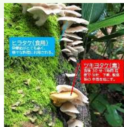
SNSによる毒きのこの注意喚起