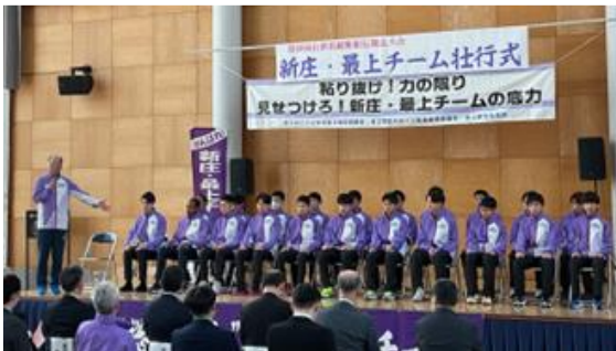
第69回大会(令和7年度開催)壮行式より

第70回山形県縦断駅伝が、 4月27日(月)～29日(水)の3日間、 全29区間にわたり開催されます。 応援よろしくお祈いします。