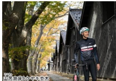
山居倉庫とケヤキ並木