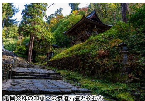
亀岡文殊の知恵への参道石畳と杉並木