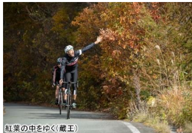
紅葉の中をゆく(蔵王)