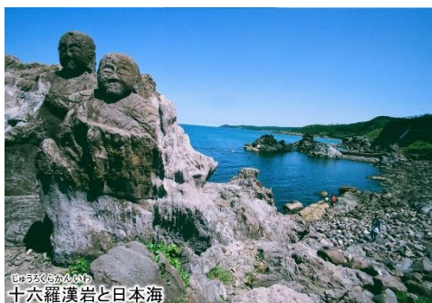
十六羅漢岩と日本海