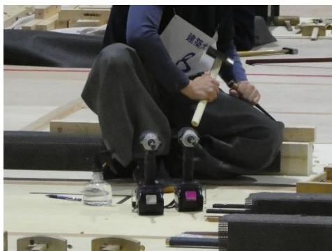
<技能五輪 建築大工>

「技能五輪」はおもに23歳以下の青年技能者が、「アビリンピック」は障がいのある技能者が、機械、建築、情報通信、ファッションなどの競技において、互いの技能を競い合う大会で、技能の重要性のアピールや能力の向上等を目的として、毎年開催されています。