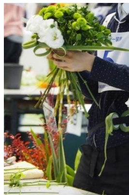
<技能五輪 フラワー装飾>