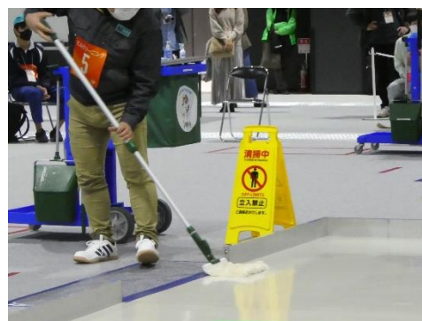
<アビリンピック ビルクリーニング>