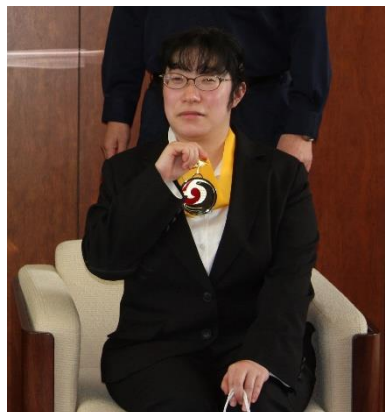
<全国アビリンピック（2020年）金賞受賞者>