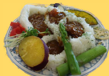
やまがたの棚田カレー @最上支庁食堂 (新庄市) ▶161食提供 (2日間)