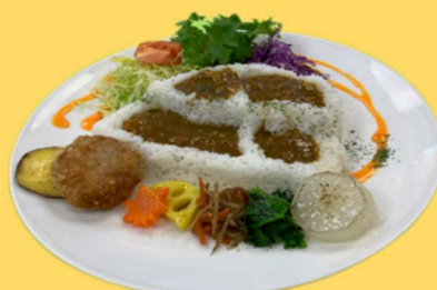
やまがたの棚田カレー秋 @県庁食堂 (山形市) ▶361食提供 (9日間)