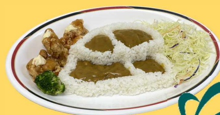
やまがたの棚田カレー @山形大学農学部食堂 (鶴岡市) ▶198食提供 (3日間)