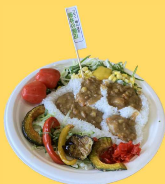
魅惑の藤井の棚田カレー @遊佐町藤井地区 (遊佐町) ▶55食提供 (1日間)