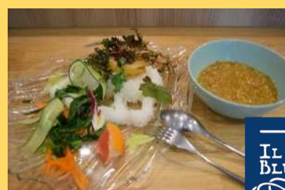
やまがたの棚田カレー @ILBLU 遊学館 (山形市) ▶291食提供 (28日間)