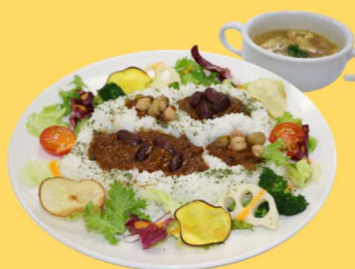
やまがたの棚田カレー @県庁食堂 (山形市) ▶380食提供 (10日間)