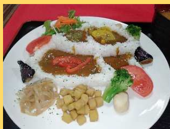
やまがたの棚田カレー @農林水産省内食堂 (東京都) ▶約600食提供 (21日間)