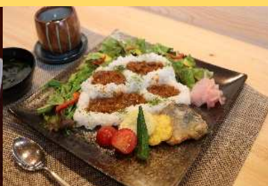
白鷹町の棚田カレーフェア @パレス松風 (白鷹町) @寿司 飛鳥井 (白鷹町) ▶62食提供 (22日間) ▶100食提供 (6日間)