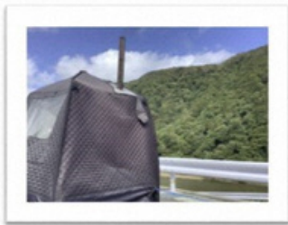
サウナ初心者でも楽しめます！

サウナストーブとサウナストーンを設置し、水をかけることで蒸気（ロウリュ）を発生させる方式のサウナです。薪の量や蒸気によりテント内の温度を自分で調節しながら、本格的なサウナを体験できます。