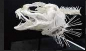
ニュウドウカジカ骨格標本：アクアマリンふくしま 蔵

魚類、両生類、は虫類、鳥類、ほ乳類の骨格標本を連続して展示し、それぞれの動物の骨格に見られる共通したつくりと、進化によって変化したつくりを比較します。外見からはわからない、骨格からわかる進化のしくみを解説します。