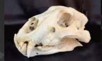
ライオン骨格標本：岩手サファリパーク 蔵

ほ乳類を中心に、身近な動物や普段目にするものないめずらしい動物の骨格標本を多数展示します。それぞれの骨格の特徴や共通点、同じ分類の動物どうしても大きく違いつくりや仕組みなどを紹介しながら、生物の多様性について解説します。