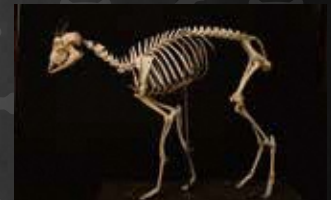
ニホンカモシカ骨格標本：寄贈 山形大学

陸上ほ乳類と鳥類を中心に、山形県に生息する動物の骨格標本を展示します。展示室では実物のはく製も並列展示しており、骨格とはく製を同時に観察・比較することができます。郷土に息づく多様な生き物たちをとおして、山形の豊かな自然の姿にせまります。