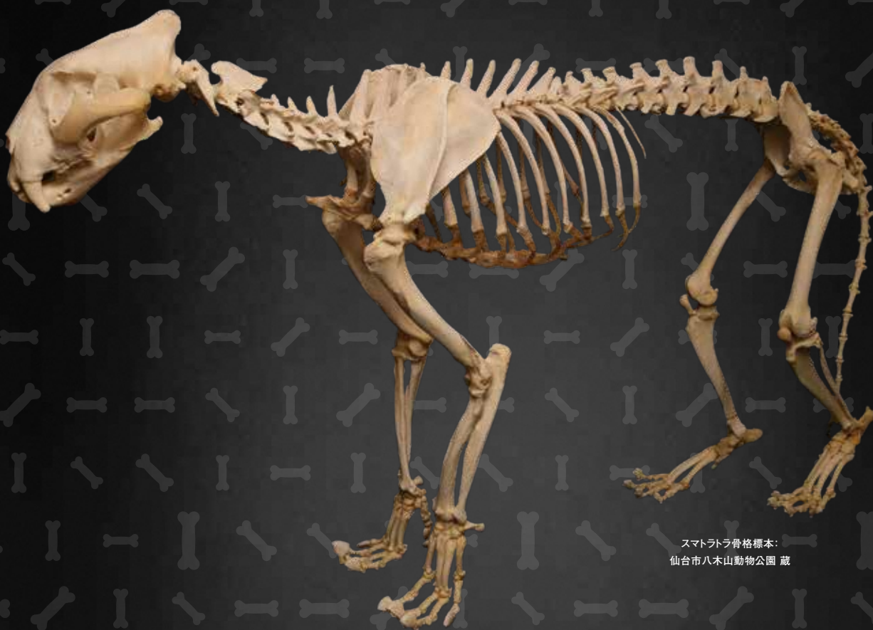
スマトラドラ骨格標本： 仙台市八木山動物公園 蔵