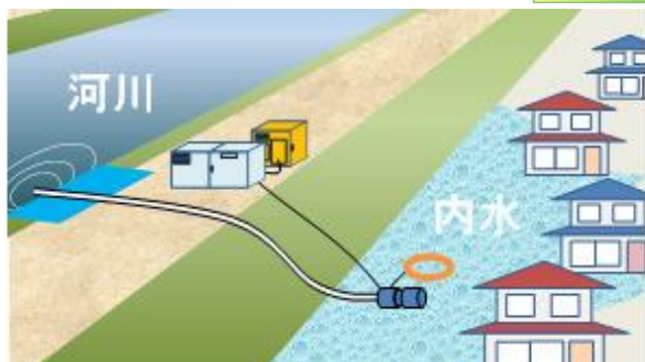
排水ポンプのイメージ