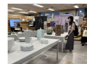
米沢駅コワーキングスペース を活用した工芸イベント