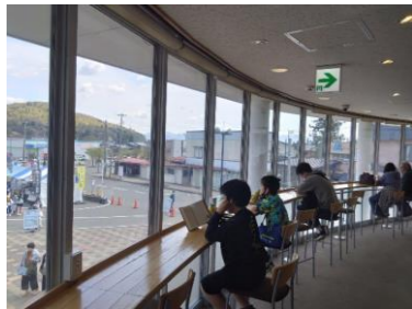
大江町交流ステーション(左沢駅併設)の coworkingスペース整備