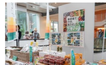
新幹線を活用した置賜地域の果物等の輸送