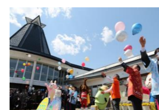
左沢線開通記念 101周年イベント