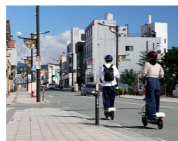
ゆめりあ 電動キックボードレンタル