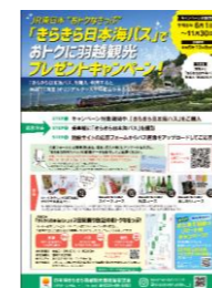
きらきら日本海パス キャンペーン