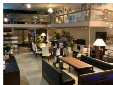
新庄駅徒歩4分の空き店舗での coworkingスペース等整備