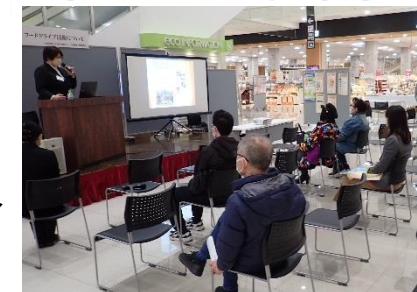
フードドライブミニ講演会 (R4.12.2)