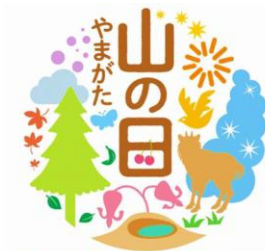
山の日全国大会 in 山形 第6回「山の日」全国大会 ロゴマーク