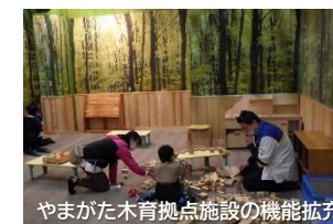
やまがた木育拠点施設の機能拡充