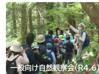
一般向け自然観察会（R4.6）