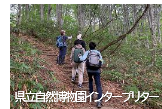
県立自然博物館インタープリター