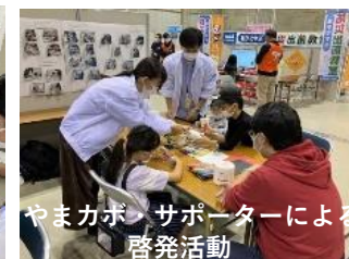
やまカボ・サポーターによる 啓発活動