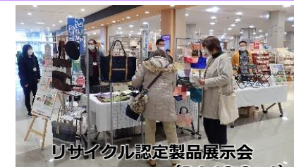
リサイクル認定製品展示会 (R4.12.2~4)