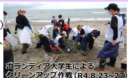
ボランティア大学生による クリーンアップ作戦(R4.8.23~27)