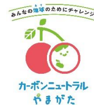
カーボンニュートラルやまがた ロゴマーク