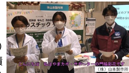
令和4年やまがた環境展 (やまカボ・サポーター取材)