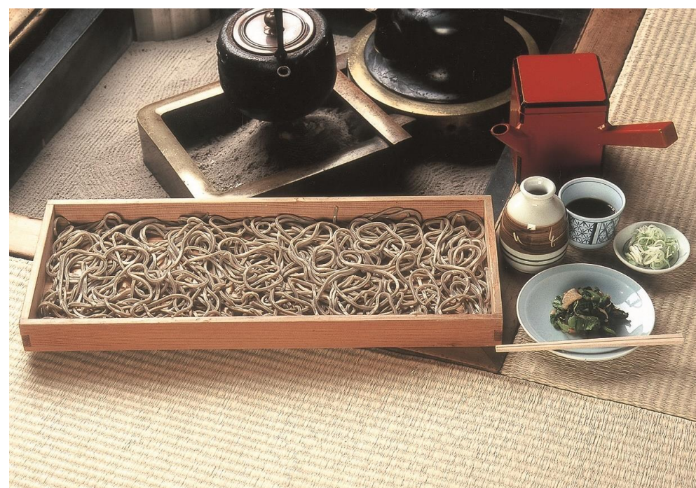
板そばまつり(村山市)