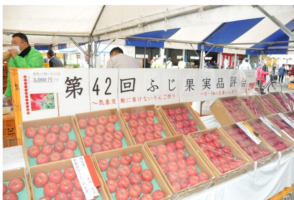
農畜産物販売会(天童市)