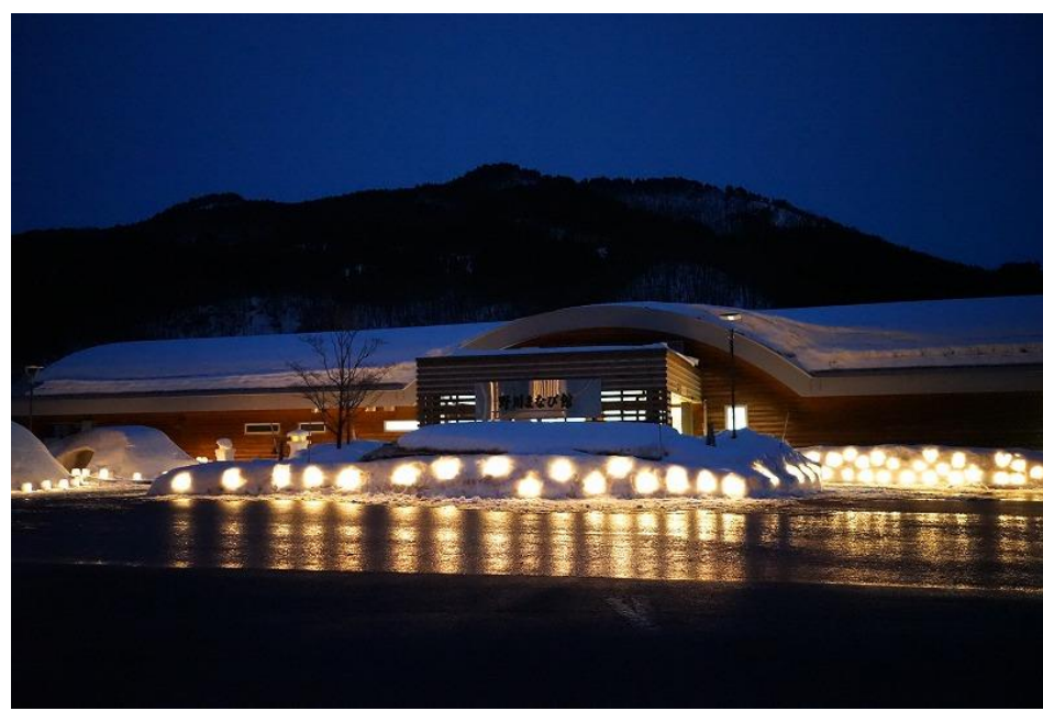
まちとダムをつなぐスノーランタン(長井市)