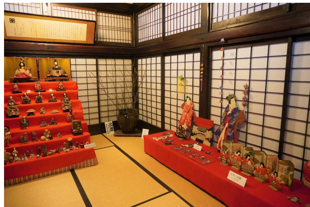
大江のひなまつり(大江町)