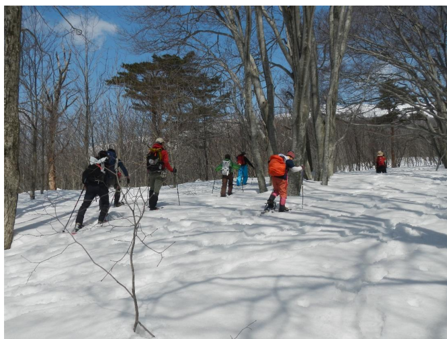
早春の鳥海山 スノーシューハイク(遊佐町)