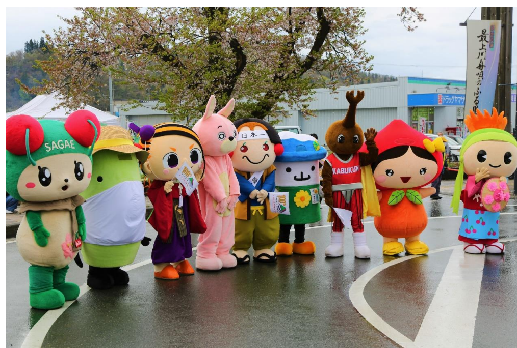
やまがたあてらざわ101フェス(大江町)