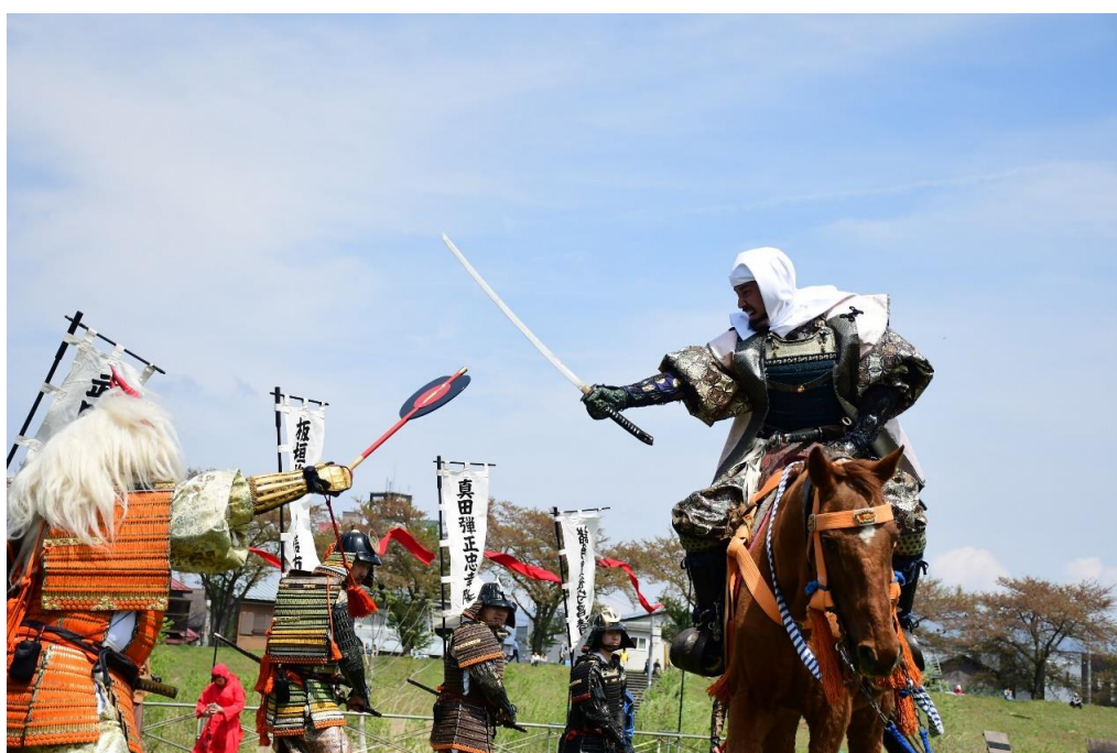
米沢上杉まつり(米沢市)