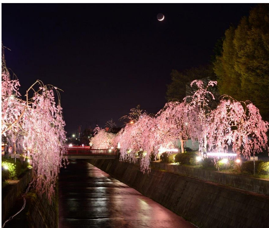
倉津川しだれ桜ライトアップ(天童市)