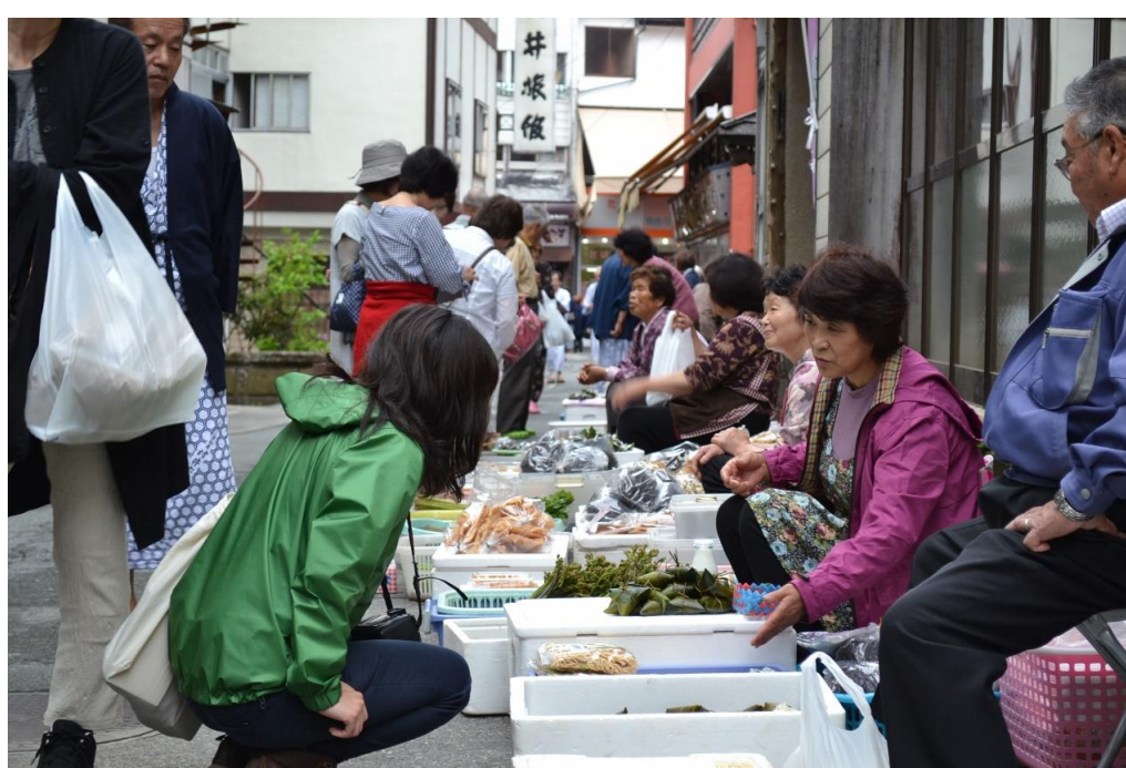
肘折温泉名物 朝市(大蔵村)