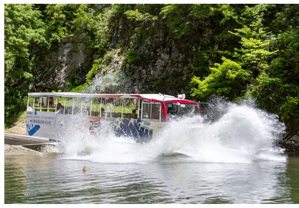
水陸両用バスinながい百秋湖(長井市)