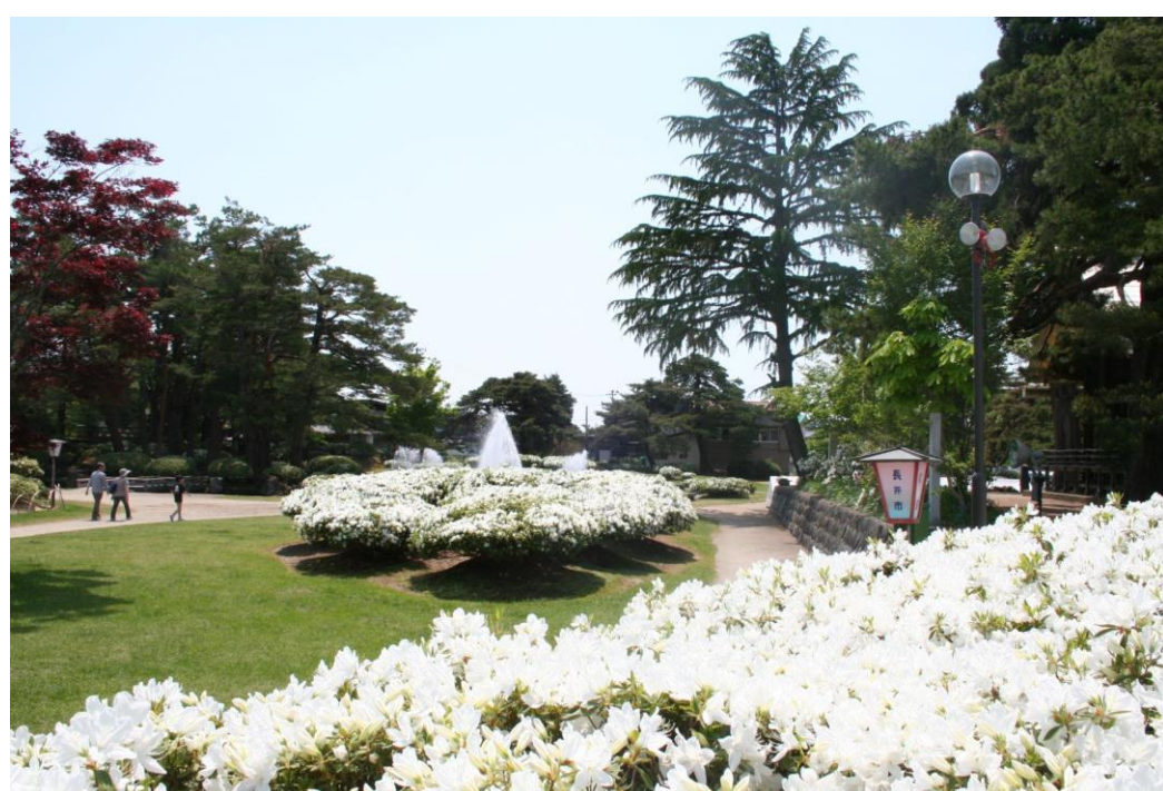
白つつじまつり(長井市)