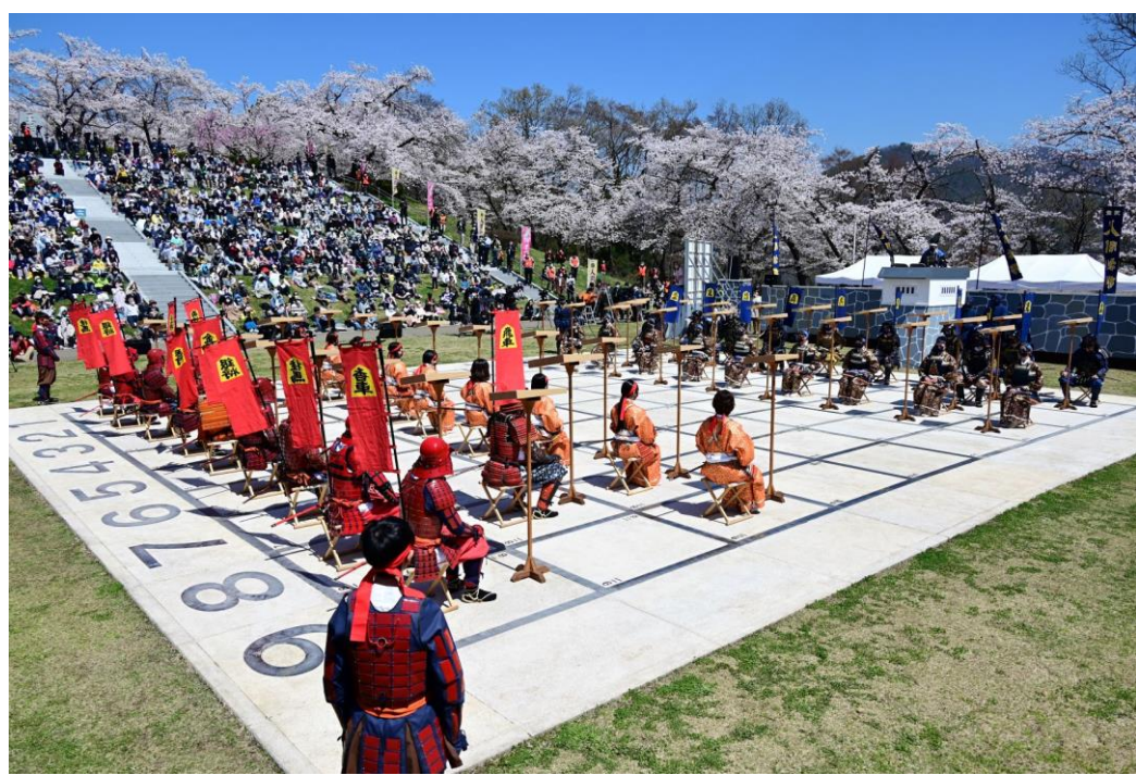
天童桜まつり「人間将棋」(天童市)