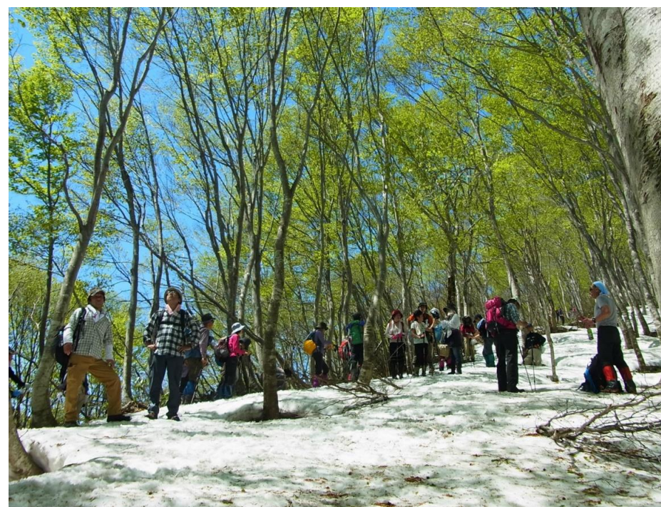
葉山民衆登山(長井市)