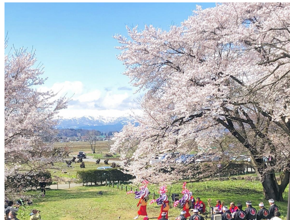
お達磨の桜まつり(中山町)