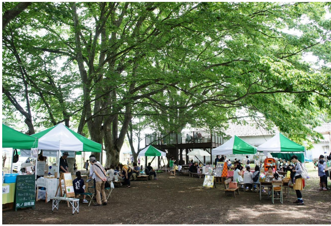
キトキトマルシェ(新庄市)