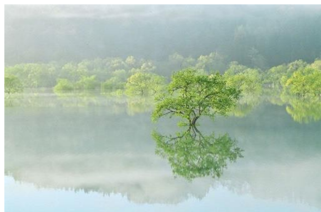
白川湖水没林(飯豊町)