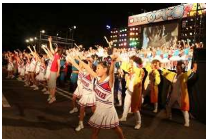
東根市 ひがしね祭