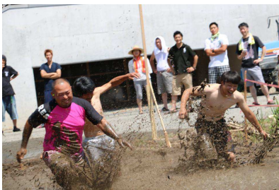
戸沢村 TSUNOKAWA Summer Party2017