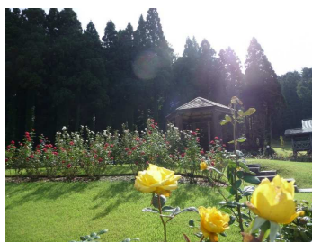
村山市 秋のバラ祭り