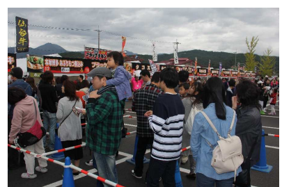
東根市 た～んとほおバルフェスタ