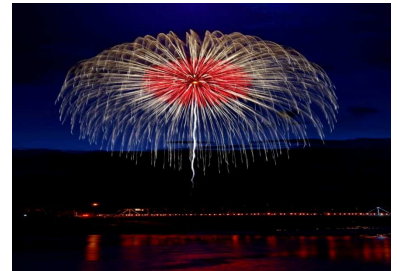
大石田町 大石田まつり「最上川花火大会」