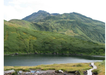
遊佐町 『鳥海山登山ツアーⅣ』 【7合目縦走コース】