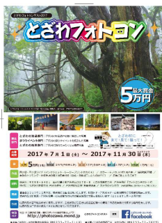
戸沢村 とざわ フォトコン