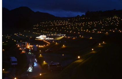
大蔵村 四か村棚田ほたる火コンサート