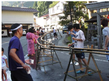
最上町 日曜朝イチ流しそうめん