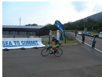
遊佐町 鳥海山SEA TO SUMMIT