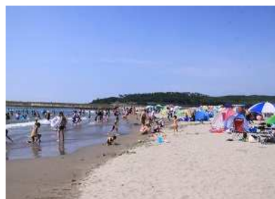
遊佐町 海水浴場開き