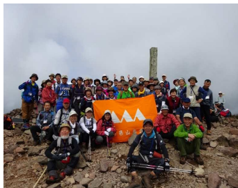
東根市 御所山市民登山