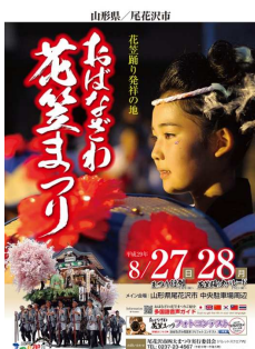
尾花沢市 おばなざわ 花笠まつり