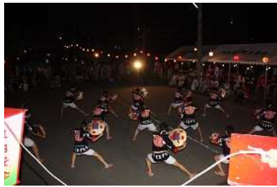
最上町 赤倉温泉 夏祭り