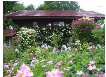
上山市 蔵王ペンション村オープンガーデン～山 の秋の庭～