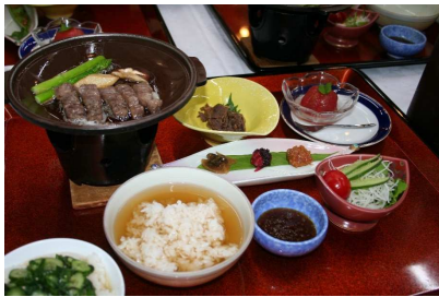
最上町 水かけまんまフェア