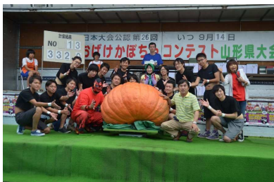
東根市 おばけかぼちゃコンテスト山形県大会