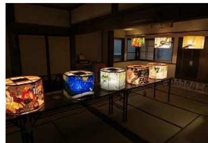
大蔵村 ひじおりの灯