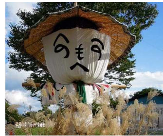
上山市 かかし祭り