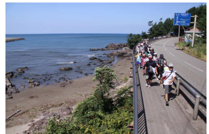
遊佐町 奥の細道鳥海ツアーデーマーチ