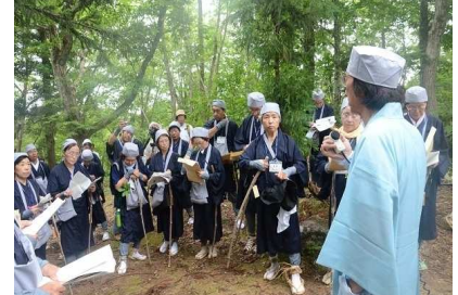
尾花沢市 おくのほそ道 山刀伐峠越え体験ツアー