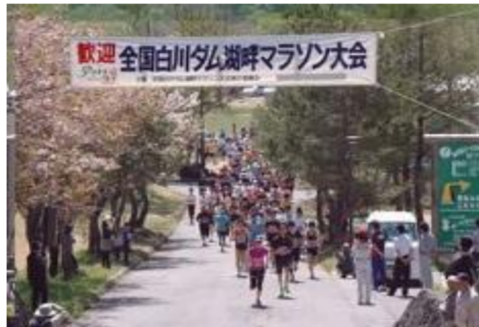
飯豊町 第34回全国白川ダム湖畔 マラソン大会