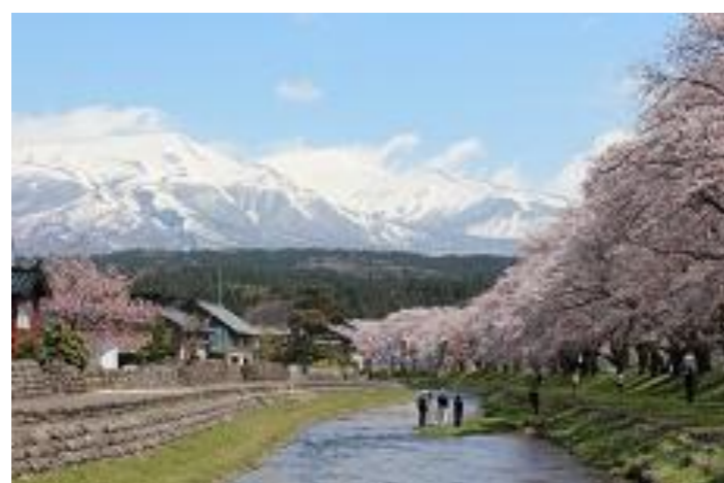
遊佐町 中山河川公園さくらまつり2016