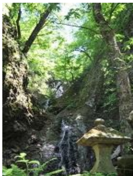
白鷹町 三ツ滝不動尊 祭礼