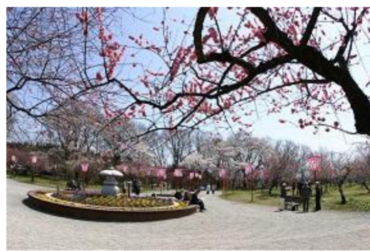
真室川町 第44回真室川梅まつり