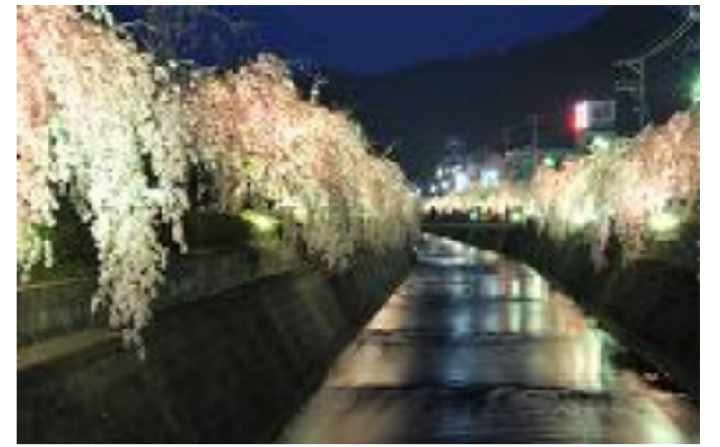
天童市 しだれ桜まつり