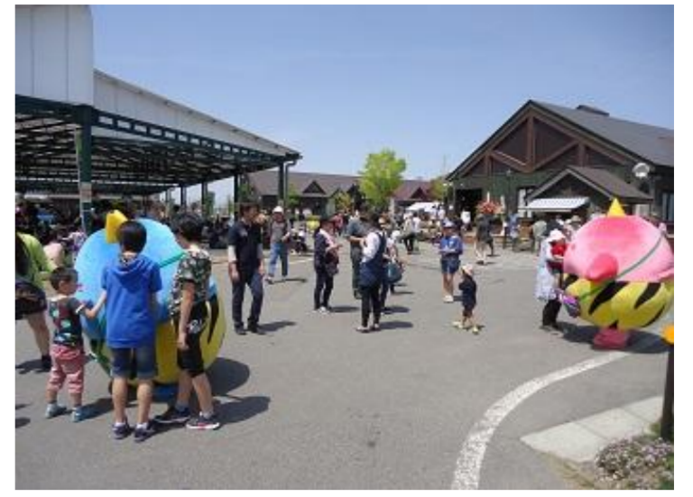
高畠町 高畠ワイナリー スプリングフェスタ