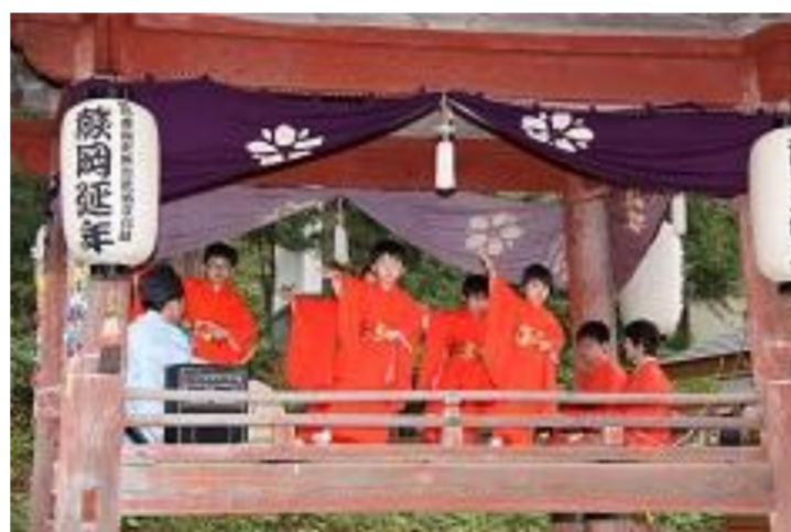
遊佐町 鳥海山大物忌神社 蕨岡口ノ宮例大祭