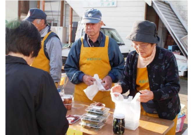
川西町 ニュースタイル朝市こまつ市