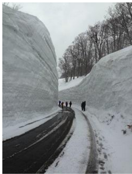
西川町 月山雪の回廊 ウォーキング