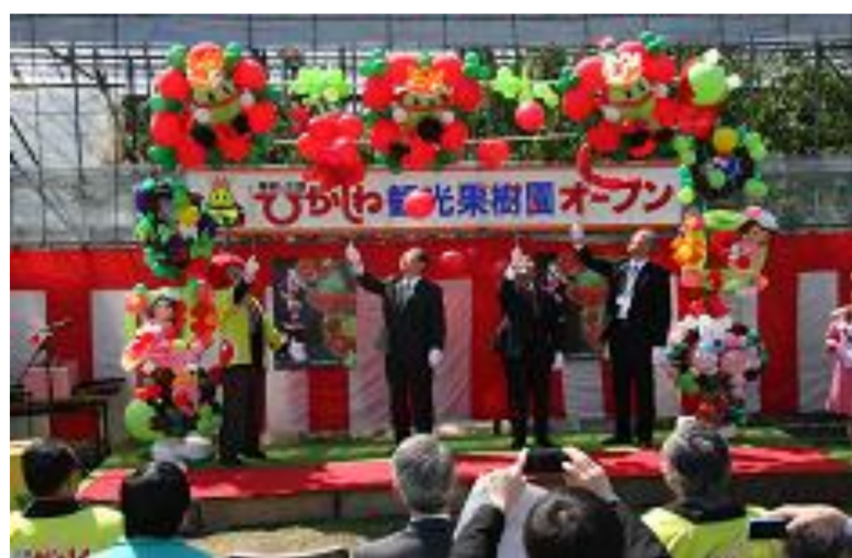
東根市 観光果樹園オープン式