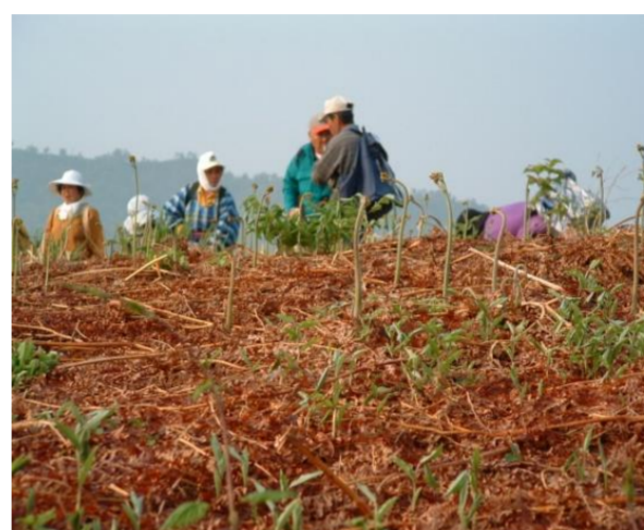
飯豊町 観光ワラビ園オープン