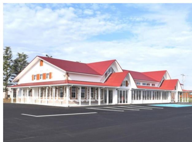
川西町 かわにし森のマルシェ オープン