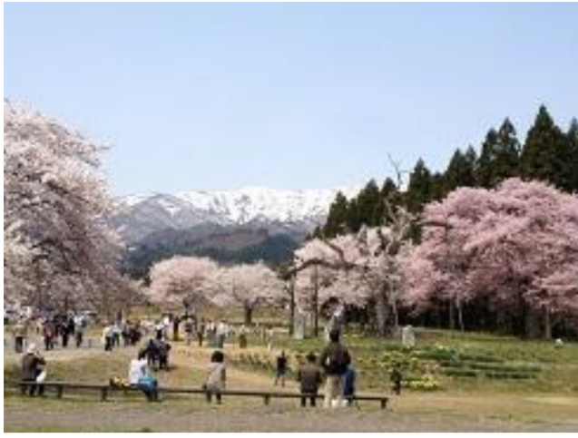
白鷹町 釜の越・薬師さくらまつり