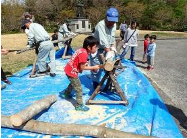
山辺町 県民の森オープニングイベント