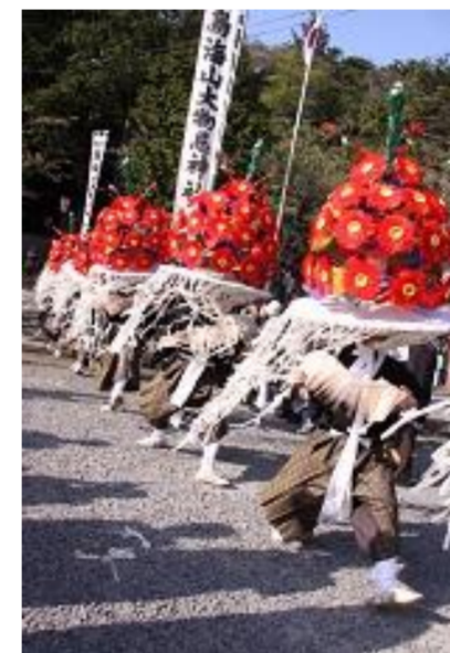
遊佐町 鳥海山大物忌神社 吹浦口ノ宮例大祭