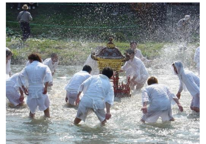
鶴岡市 鼠ヶ関の神輿流し