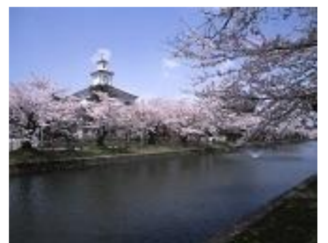
鶴岡市 鶴岡桜まつりお花見茶会