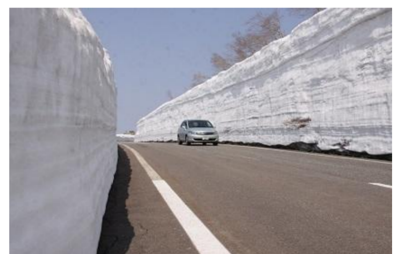
遊佐町 鳥海ブルーライン開通式・春山開き