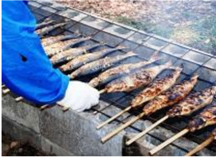
新庄市 新庄カド焼きまつり