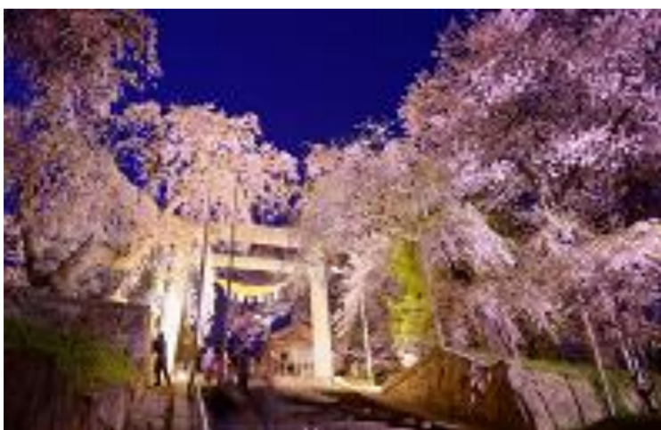
南陽市 赤湯温泉桜まつり 烏帽子山公園ライトアップ