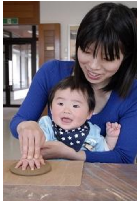
高畠町 赤ちゃんの 手形をつくろう