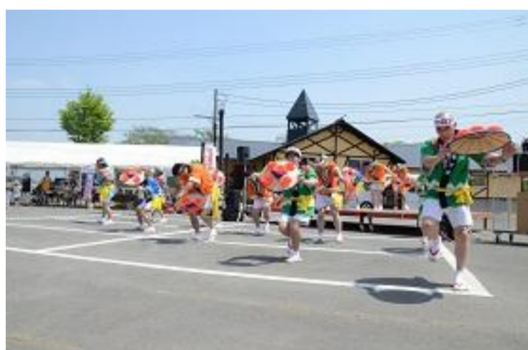
尾花沢市 第47回尾花沢徳良湖まつり