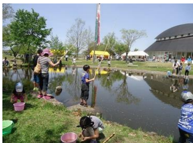
高島町 ひろすけ子ども祭