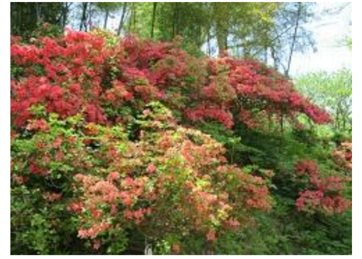
天童市 天童つつじまつり