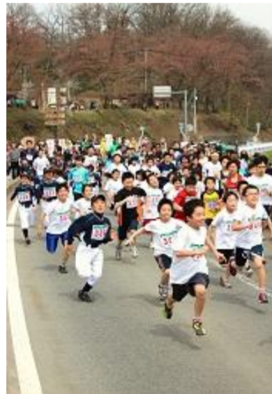
真室川町 第29回 梅の里マラソン大会