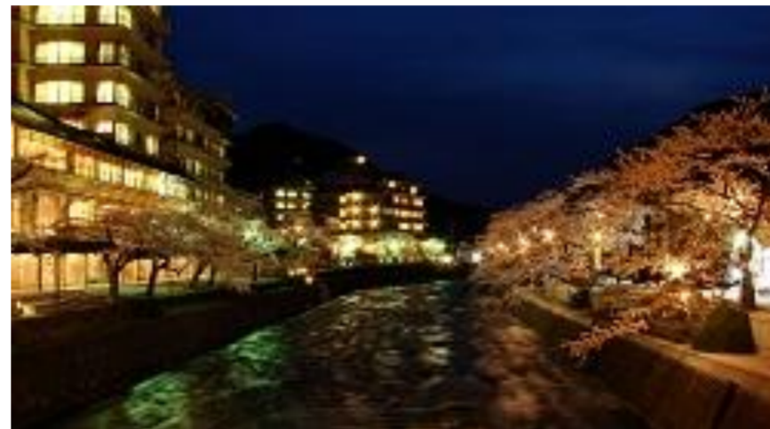
鶴岡市 あつみ温泉 温海川河畔桜並木