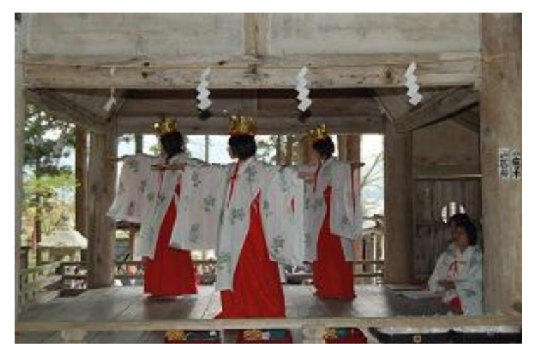
高島町 安久津八幡神社春まつり