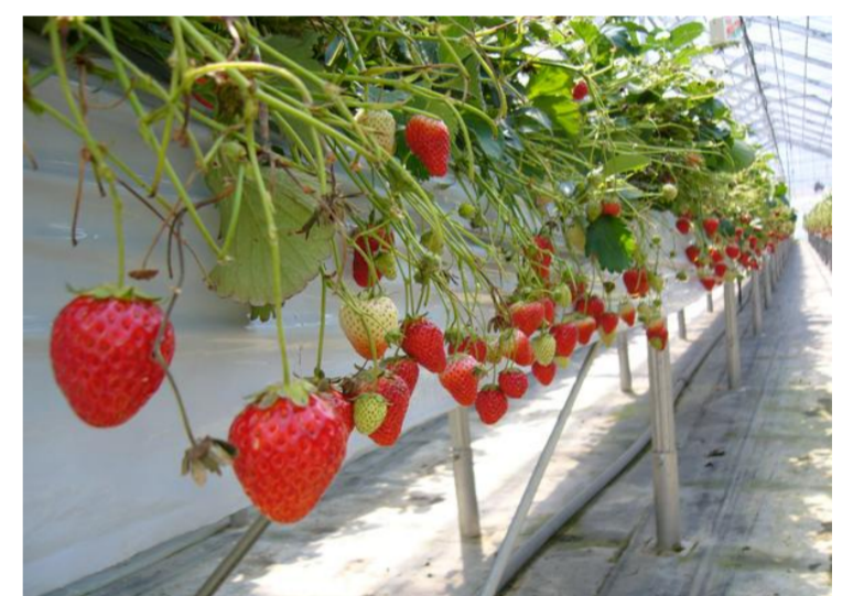
飯豊町 いちご狩り