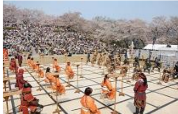
天童市 天童桜まつり 第61回人間将棋