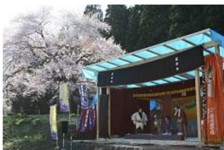
白鷹町 高玉芝居上演