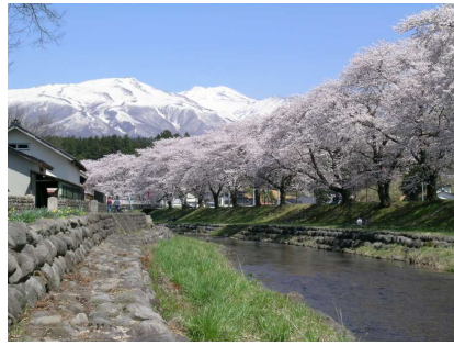
中山河川公園桜まつり(遊佐町)