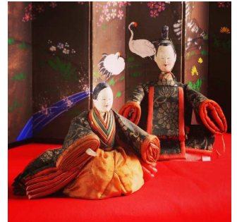
大石田ひなまつり(大石田町)