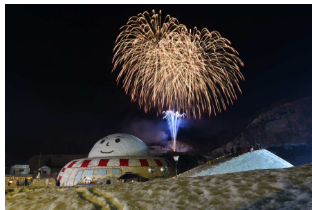
おおくら雪ものがたり(大蔵村)