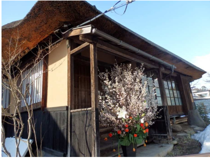
かみのやま桜フェス(上市市)