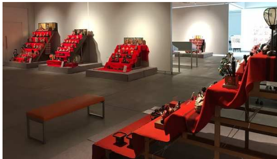
東根のひな飾り(東根市)