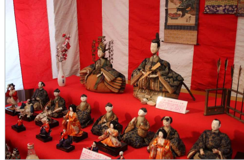
瀬見温泉 春の宴「ひなまつり」(最上町)