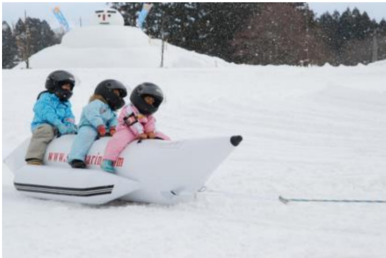
どんでん平スノーパークオープン (飯豊町)