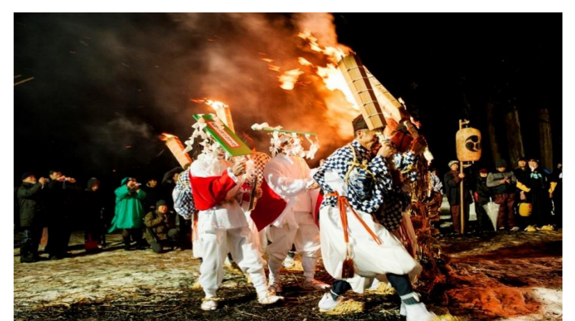
羽黒山松例祭(鶴岡市)