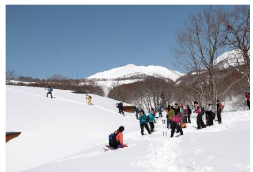
西川・月山スノーシューパーク (西川町)