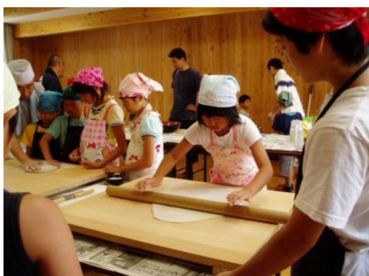
”年越しそば”打ち体験(遊佐町)