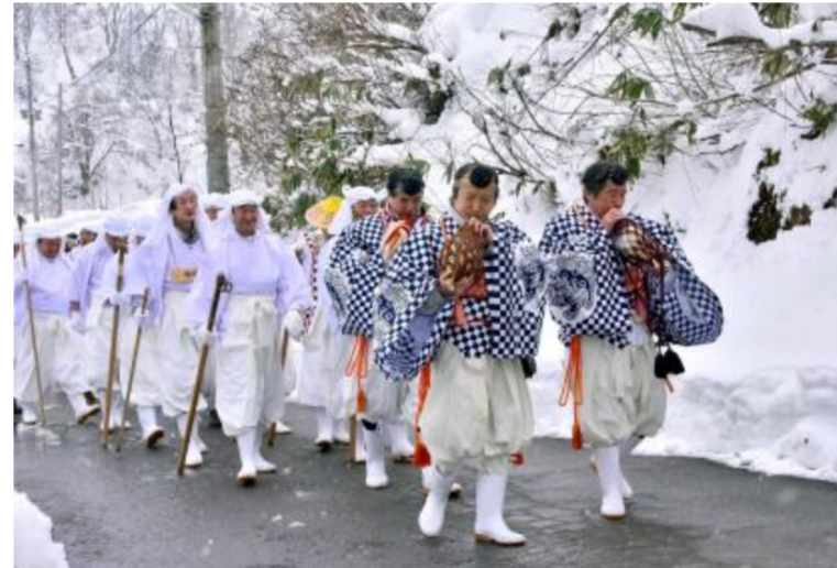
肘折さんげさんげ(大蔵村)