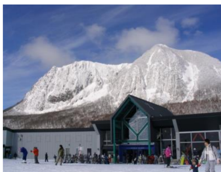
黒伏高原スノーパーク 「ジャングル・ジャングル」オープン(東根市)