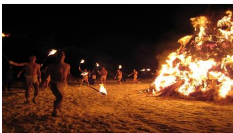
赤倉温泉 お柴灯まつり(最上町)