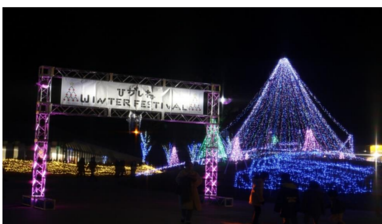
ひがしねウィンターフェスティバル(東根市)