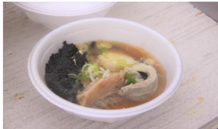
ゆざ町鱈ふくまつり(遊佐町)