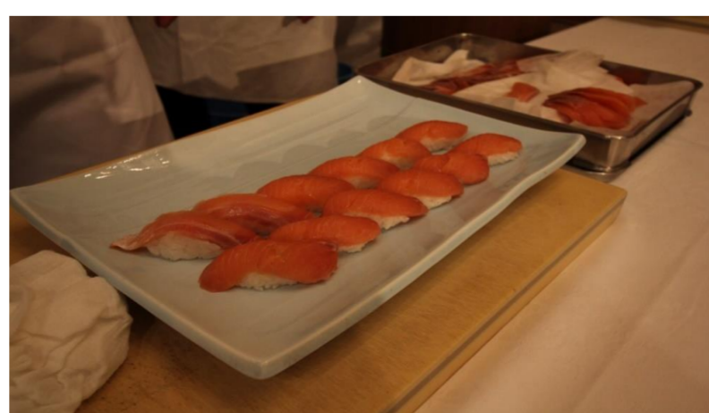
遊佐町フードフェスタ2019(遊佐町)