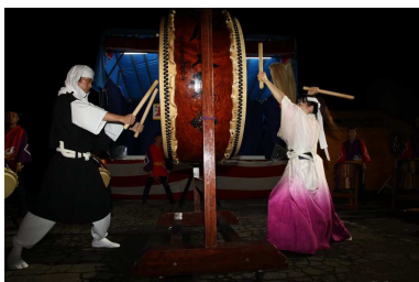
最上町 瀬見まつり