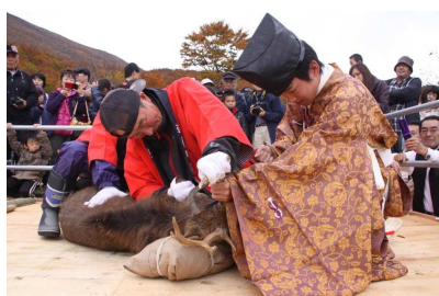
遊佐町 鳥海山神鹿角切祭