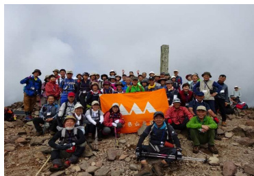
東根市 御所山市民登山