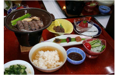
最上町 水かけまんまフェア