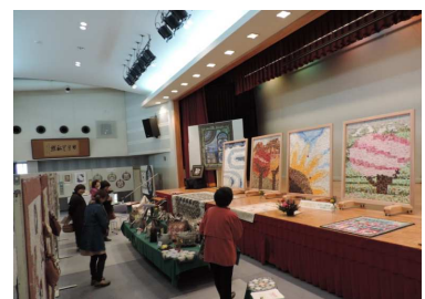
最上町 最上町総合芸術文化祭