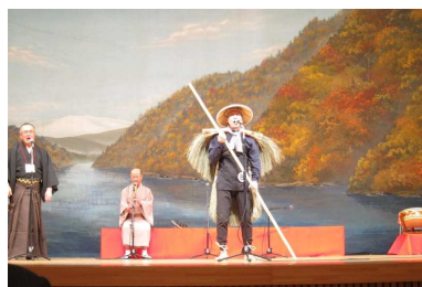
東根市 最上川舟唄全国大会