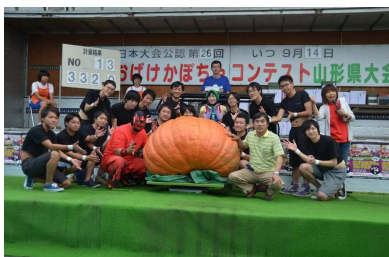
東根市 おばけかぼちゃコンテスト山形県大会