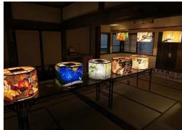
大蔵村 ひじおりの灯