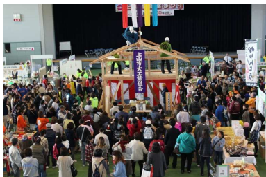
上山市 上山市産業まつり