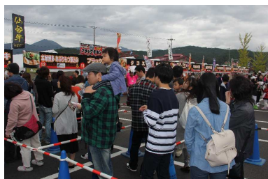
東根市 た～んとほおバルフェスタ