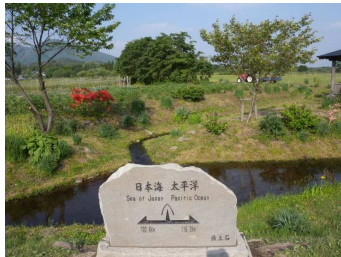
最上町 塚田分水嶺秋のコンサート