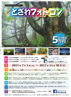
戸沢村 とざわ フォトコン