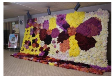
川西町 かわにし産業フェア