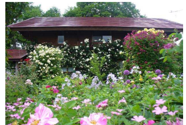
上市市 蔵王ペンション村オープンガーデン ～山の秋の庭～