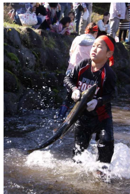
遊佐町 鮭のつかみ どり大会