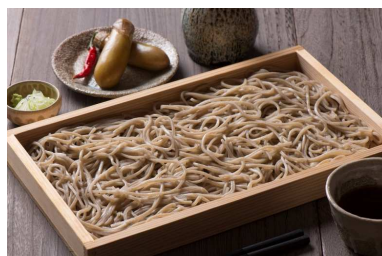
大石田町 新そばまつり