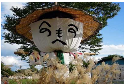
上山市 全国かかし祭り