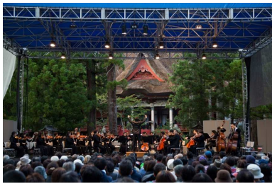
鶴岡市 出羽三山シンフォニー