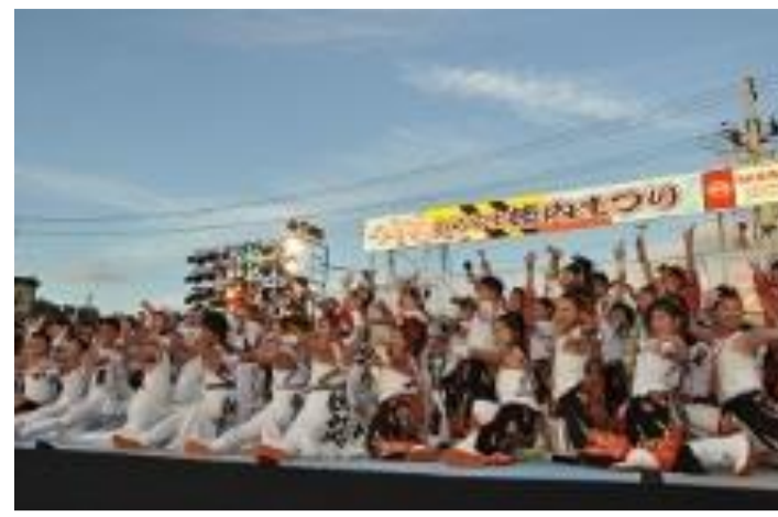
村山市 むらやま徳内まつり