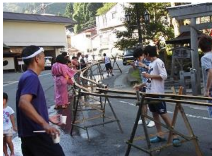
最上町 日曜朝イチ流しそうめん