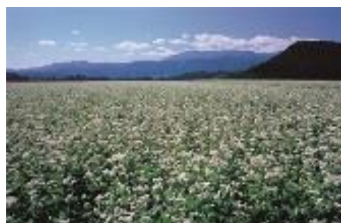
村山市 そば花まつり