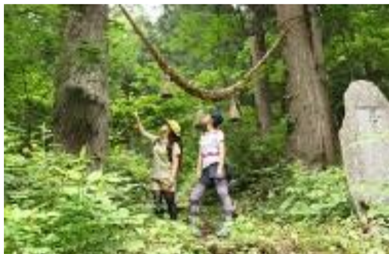
上山市 夏の里山クアオルト空色ウォーキング