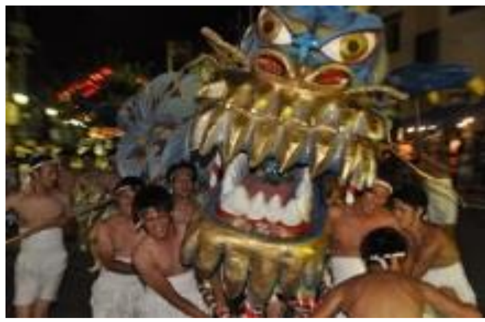
高島町 青竹ちょうちんまつり