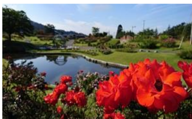
村山市 秋のバラまつり