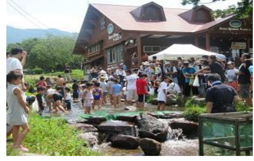
最上町 前森高原サマーフェスティバル