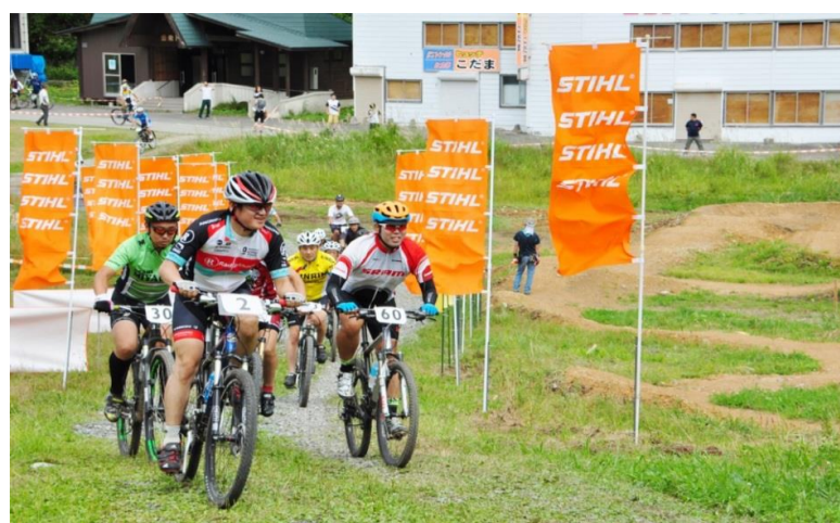
最上町 もがみMTB大会in赤倉温泉スキー場