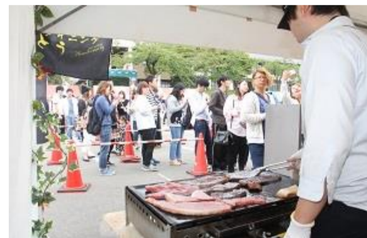
東根市 た〜んとほおバルフェスタ inひがしね2018