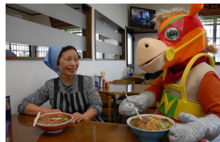
長井市 ながい馬肉の日