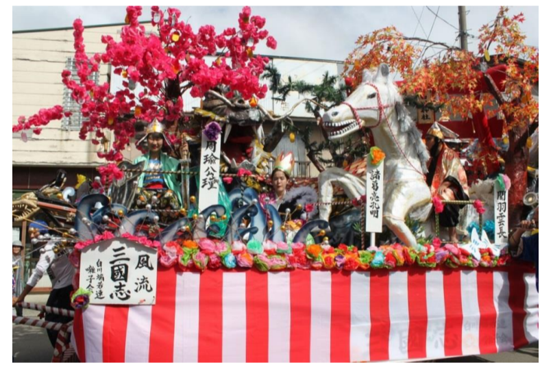
最上町 大堀まつり