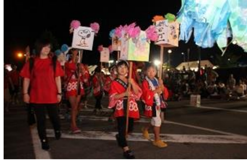
東根市 ひがしね祭