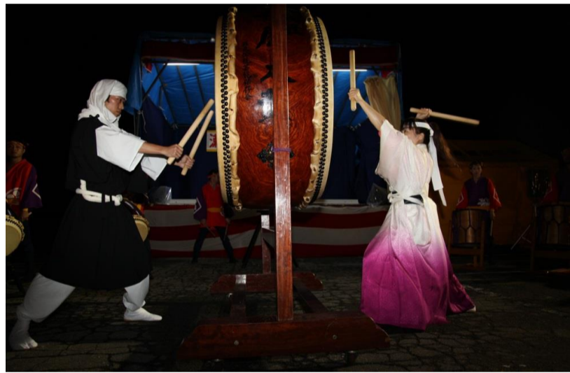
最上町 瀬見まつり