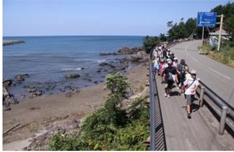
遊佐町 奥の細道鳥海ツーデーマーチ