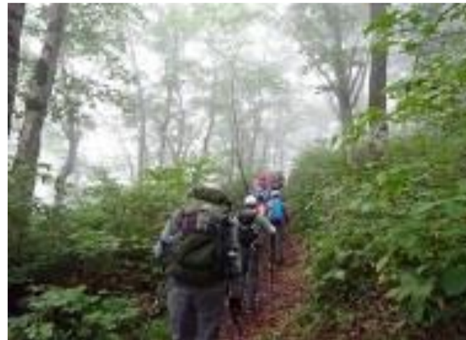
東根市 御所山市民登山