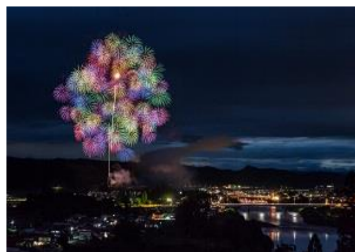
大石田町 大石田まつり「最上川花火大会」