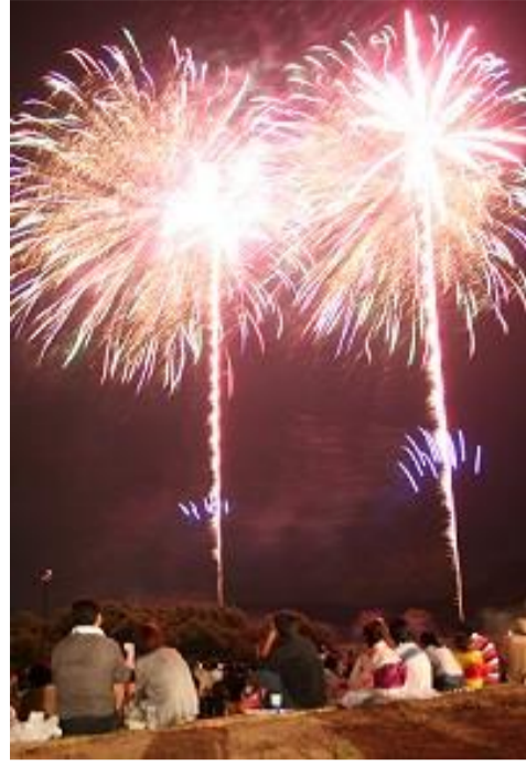
長井市 ながい水まつり・最上川花火大会