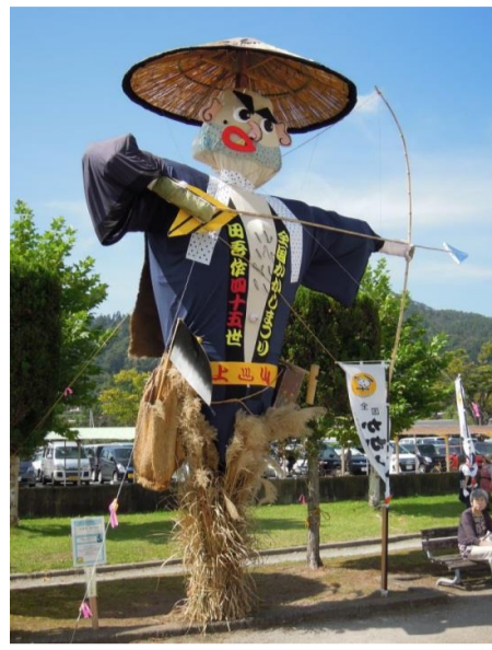
上山市 かみのやま温泉全国かかし祭