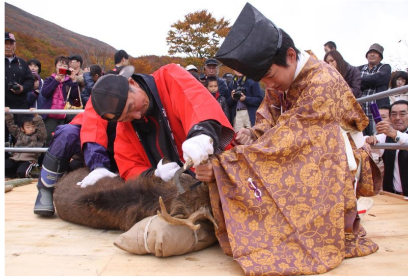
遊佐町 鳥海山神鹿角切祭