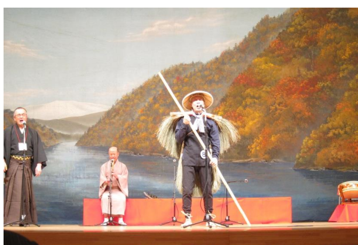
東根市 最上川舟唄全国大会