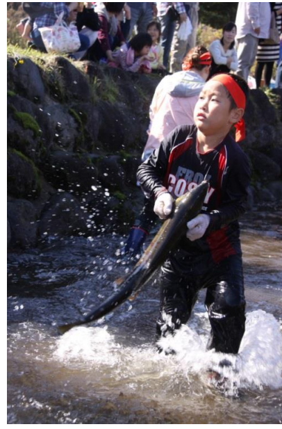
遊佐町 鮭のつかみどり大会