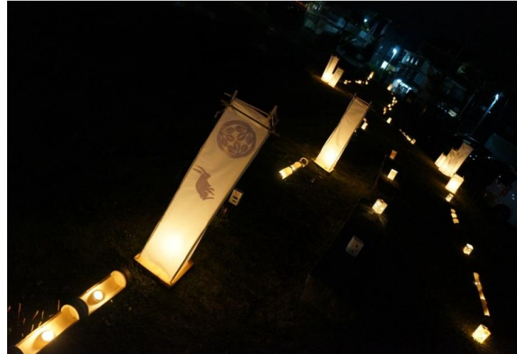
最上町 赤倉温泉 豆名月・栗名月