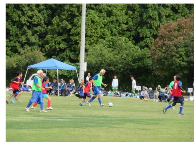
最上町 Super Senior Soccer