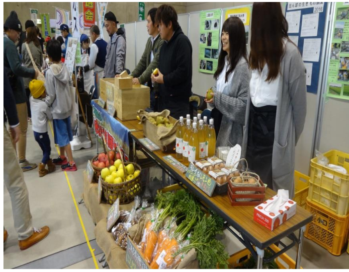
天童市 やまがたオーガニックフェスタ