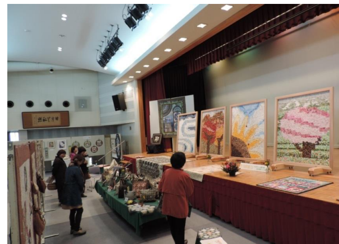
最上町 最上町総合芸術文化祭