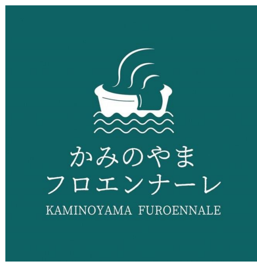
上山市 かみのやまフロエンナーレ