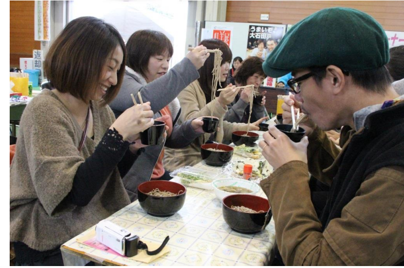
大石田町 大石田町新そばまつり