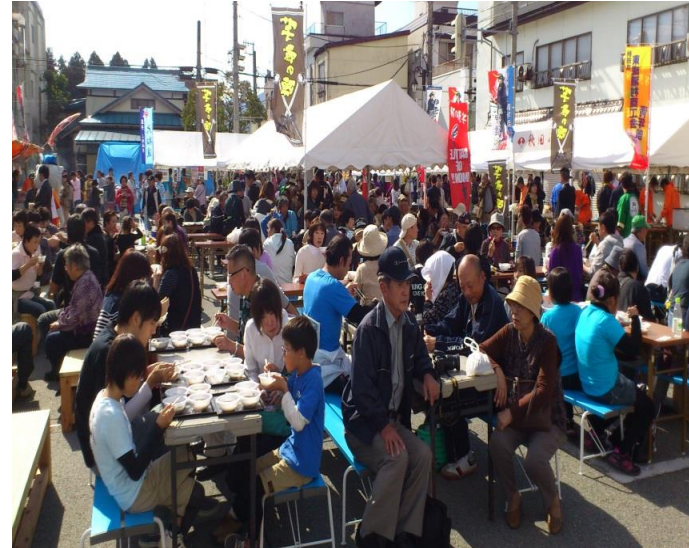
最上町 最上町大産業まつり