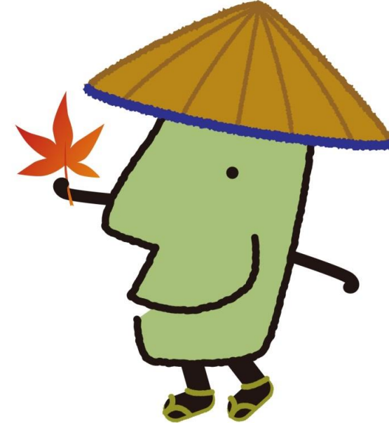
上山市 秋の里山クアオルト 暮色(くれいろ)ウォーキング