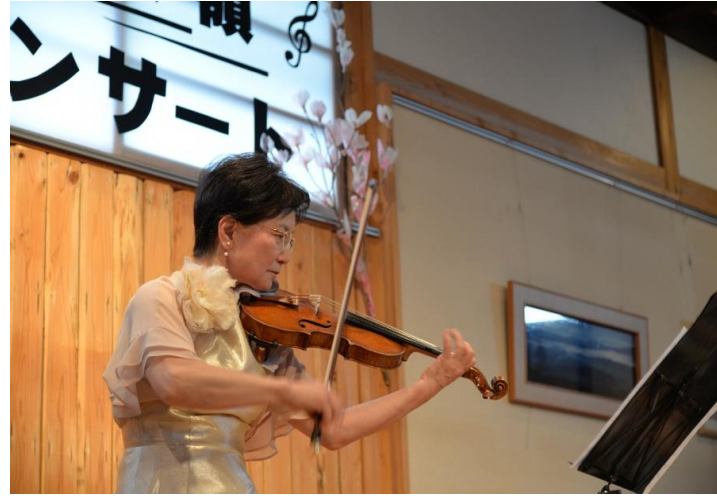
最上町 堺田分水嶺秋のコンサート