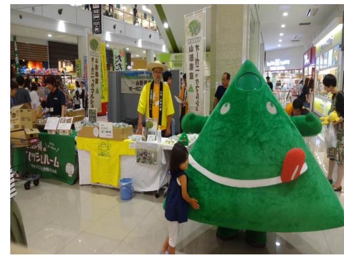
天童市 山形県産オーガニックマルシェ