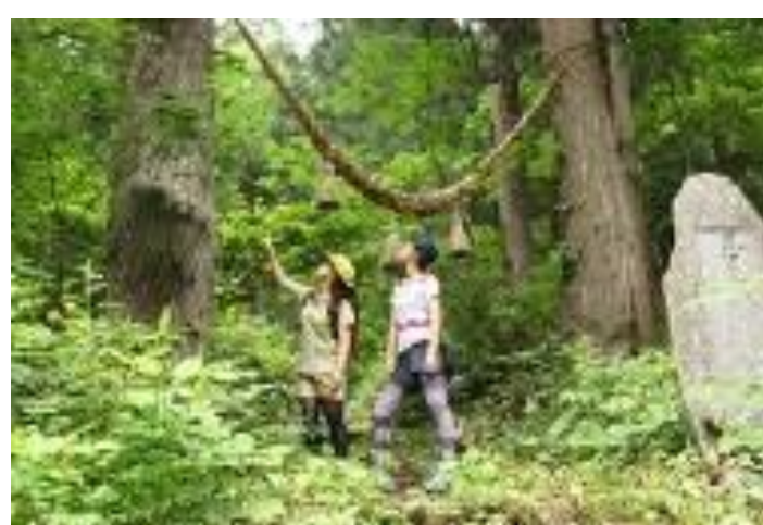
上山市 夏の里山クアオルト空色ウォーキング