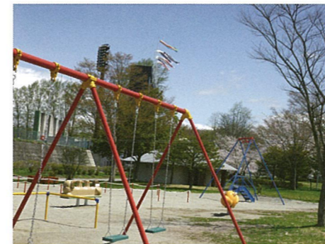
子どもたちが元気に遊べるスペース (児童広場)