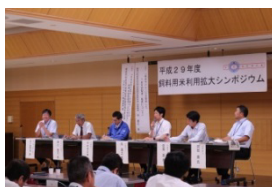
飼料用米シンポジウム