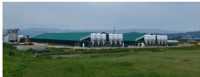
畜産クラスター事業でH28に整備した大規模豚舎(南陽市)