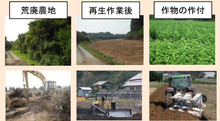
再生作業(障害物除去・深耕・整地等) 土づくり(土壌改良)