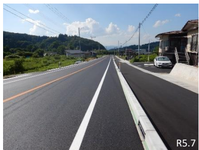
歩道整備L=583m (上山市永野)