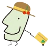
きてけろくん (山形県)