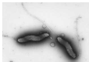
カンピロバクターの電子顕微鏡写真

食肉の加熱不足を原因とするカンピロバクター食中毒が全国で多く発生しています。適切に取り扱い、 十分な加熱調理 をして、安全に食べましょう。