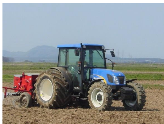
乾田直播栽培技術 （ドリルシーダーによる播種）

そこで、秋季に播種床造成を行い、春季は播種作業のみとする作業体系と、この体系に適した施肥方法を開発することで、春作業の適期が短い本県においても円滑に導入可能な積雪寒冷地適応型の乾田直播栽培技術の確立を図ります。