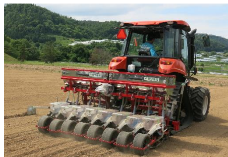
高速・高精度播種が可能な大豆播種機

そこで、大規模経営体が抱える様々な課題を解決する要素技術を組み立て、実証を行います。水田転換畑の復田手法や高速耕起・整地作業、高速・高精度播種、小麦の高収益作付体系等、大規模経営体が活用できる要素技術を組み合わせることで、効率的な作業技術体系を確立し、生産性と収益性の向上を図ります。