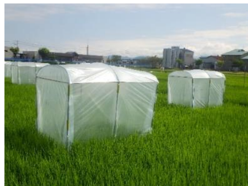
小型ビニールハウスによる高温条件の再現

そこで、高温登熟条件における稲体窒素栄養や根の活性を解析することで、品質低下を抑制する技術開発を進めます。また、温暖化の進行が育苗管理や移植後の水管理にも影響することから、温暖化に適した健苗育成技術や土壌の異常還元に対応した栽培管理技術の開発に取り組みます。