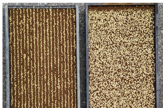
専用播種機による高精度な疎播（左）

そこで、業務用の「はえぬき」を対象に疎播・疎植を基盤技術として、高精度な播種技術、スマート農機による高精度移植、脱プラスチック肥料による全量基肥施肥を組み合わせ、省力・低コスト栽培技術体系の確立を目指していきます。