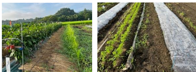
野菜の有機栽培（左：緑肥活用 右：太陽熱処理）

そこで、主要品目の有機野菜の収量向上を図るため、「施肥技術構築等による有機野菜栽培技術の開発」に取り組んでいます。具体的には、バイオマスプラント副産物である肥効の高い「メタン発酵消化液」活用と太陽熱処理(マルチ処理等)による有機物の肥効促進技術等について検討します。