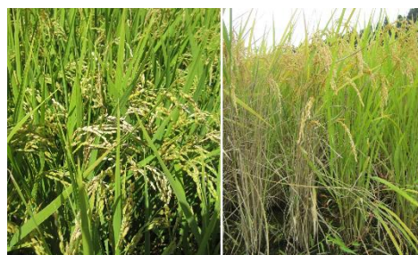
いもち病（穂いもち、左）と紋枯病（右）

そこで、いもち病や紋枯病の温暖化条件下での発生に及ぼす気象要因や農薬の作用等を解析し、いもち病圃場抵抗性遺伝子の活用や紋枯病の防除要否判断基準の作成等により、SDGsの達成にも貢献する水稻主要病害の防除体系を構築します。