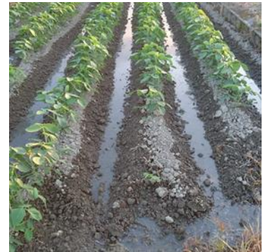
大豆のうね間灌水

大豆栽培において、干害は湿害とともに主な収量低下の要因です。しかし、大豆で特に水が必要な開花期は、水稲でも水が必要となるため大豆圃場への灌水をためらう事例もみられ、土壌乾燥対策を行うことが増収に向けて重要です。本研究では、地理・土壌の情報と気象データを基に土壌水分量を推定し、灌水の適期を診断する情報システム「大豆灌水支援システム」を山形県内で検証し、うね間灌水を行った場合の増収効果を明らかにします。この「大豆灌水支援システム」を活用し、異常気象被害を軽減することにより大豆の増収を目指します。