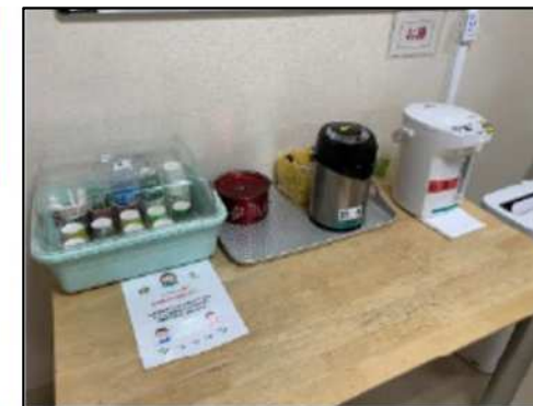
冷水・お茶の提供 (東京都新宿区)