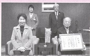
株式会社山形県自動車販売店 リサイクルセンター 様 (H30.12.5)