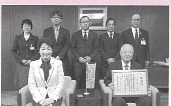
日栄電機株式会社 様 (H30.12.11)