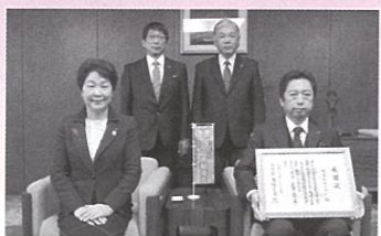
株式会社ヤマコン 様 (H30.11.28)