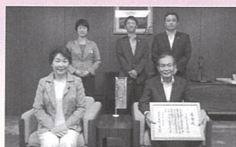
トヨタ部品宮城共販株式会社 様 (H30.9.25)