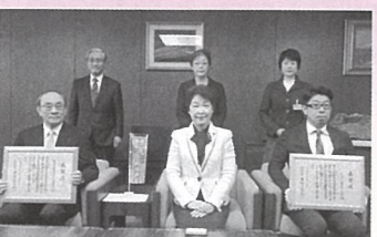
株式会社蔵王サプライズ 様 株式会社東北シーアイシー研究所 様 (H30.12.11)