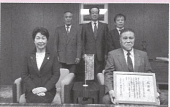
山形県民共済生活協同組合 様 (H30.11.28)