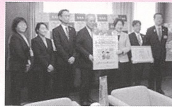
イオン株式会社 様 (H30.2.28)