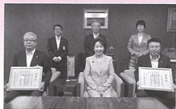
山形日産自動車株式会社 様 日産プリンス山形販売株式会社 様 (H30.9.7)