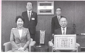
株式会社山本製作所 様 (H30.2.23)