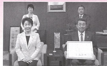
株式会社エルデック 様 (H30.8.7)