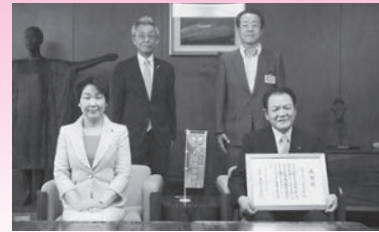
山形トヨペット株式会社 様 (平成29年7月13日) 【団体支援寄附】