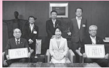
山形日産自動車株式会社 様 日産プリンス山形販売株式会社 様 (平成29年7月13日) 【テーマ希望寄附・団体支援寄附】