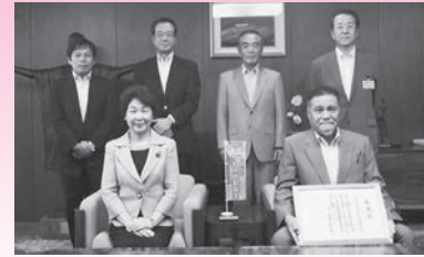
山形県民共済生活協同組合 様 (平成29年8月21日) 【団体支援寄附】