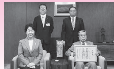
山形建設株式会社 様 (平成29年12月12日) 【団体支援寄附】