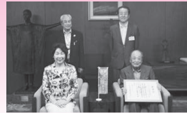
株式会社山形県自動車販売店リサイクルセンター 様 (平成29年7月12日) 【テーマ希望寄附】