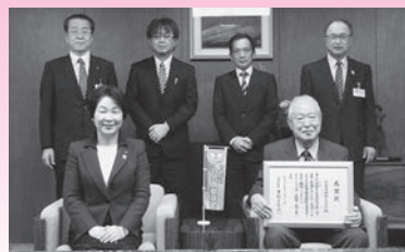
日栄電機株式会社 様 (平成29年12月11日) 【一般寄附】