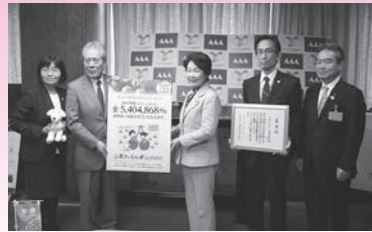
イオン株式会社 様 (平成29年3月7日) 【テーマ希望寄附】