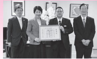
サン美術印刷株式会社 様 (平成29年10月20日) 【一般寄附】