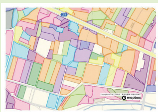
農業委員会サポートシステムを使用