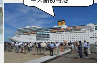
H29.8.2 外航クルーズ船初寄港