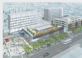
▲酒田駅前市街地再開発事業 H30年度着工、H33開業予定