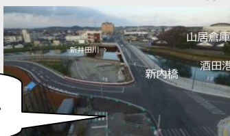
▲豊里十里塚線の整備状況