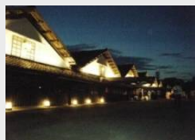
▲山居倉庫ライトアップ H29整備 (都市再生整備計画事業)