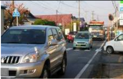
写真：現道は交通渋滞が発生

天童大江線は、天童 IC 等へのアクセス道路であり、交通量の増加が見込まれます。バイパスを整備することで、蔵増地区内の 安全性向上 と IC 等への アクセス性向上 を図る事業です。