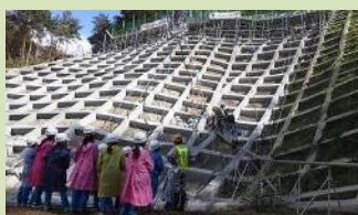
東根小学校の現場見学会

・保全人家の安全確保 ・重要施設の多い地域のがけ崩れを防ぐことで地域全体の安全性が向上しました。