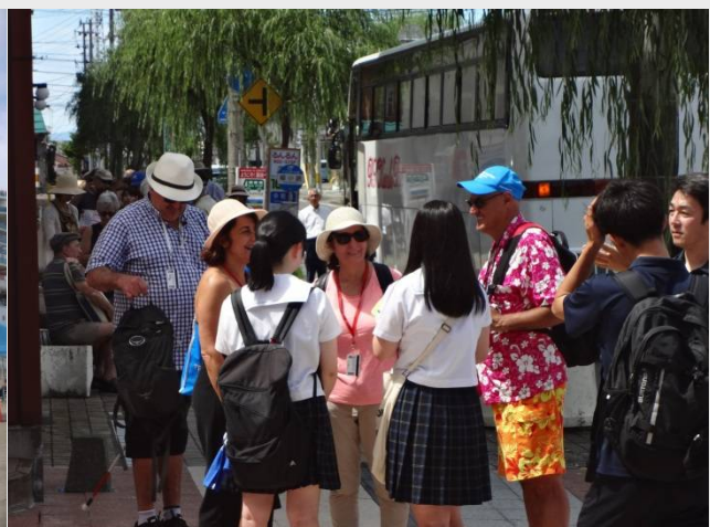
酒田市内を観光するクルーズ客に観光案内する高校生