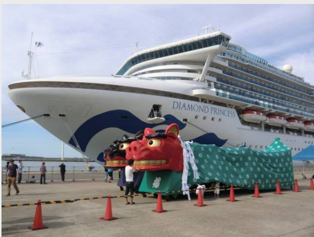
平成30年に初寄港した「ダイヤモンド・プリンセス」 (11.5万総t級)

数千人規模の観光客が見込めるクルーズ船の寄港は、観光振興や地域経済への波及効果が期待されるだけでなく、地元学生による観光案内など国際文化交流にもつながっています。