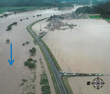
蔵岡地区浸水状況①