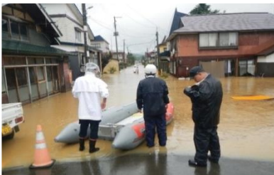
蔵岡地区浸水状況②