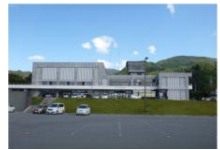
▲指定避難所「村山市民会館」