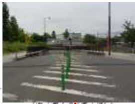
電光表示板設置 無停電化完了予定