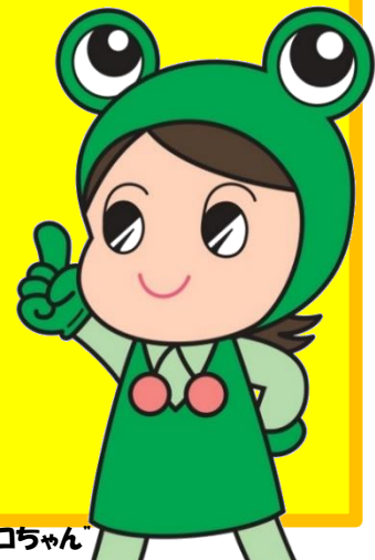
県消費生活センターキャラクター「ケロちゃん」