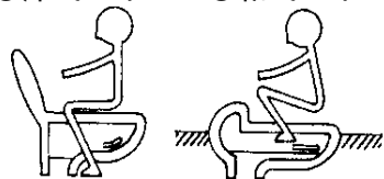
図1 ◎洋式トイレ ◎和式トイレ