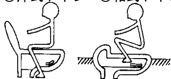
図1 ◎洋式トイレ ◎和式トイレ