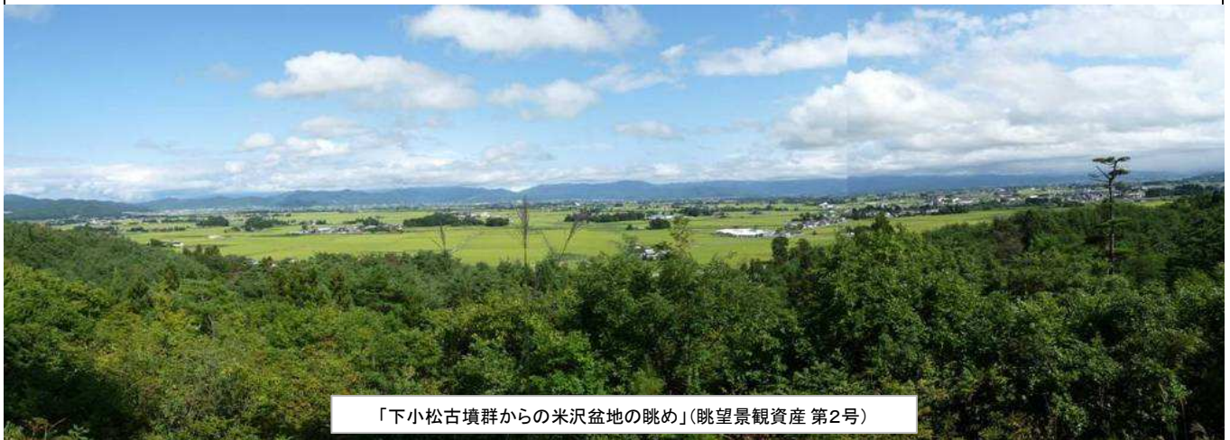
「下小松古墳群からの米沢盆地の眺め」(眺望景観資産 第2号)