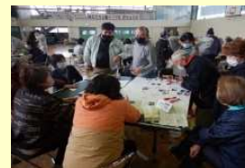
地域のお話合いによる 管理計画づくり