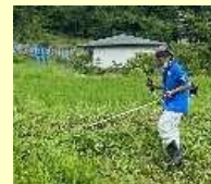
地域外からの参加