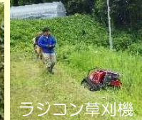
省力化機材による作業