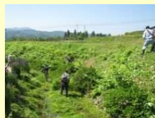
農業者のみの草刈り