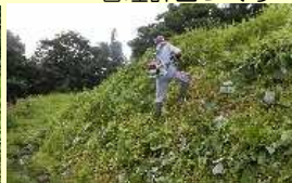
急傾斜箇所の草刈り