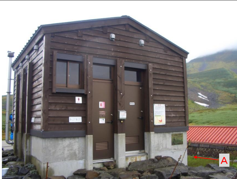
04 河原宿公衆トイレ