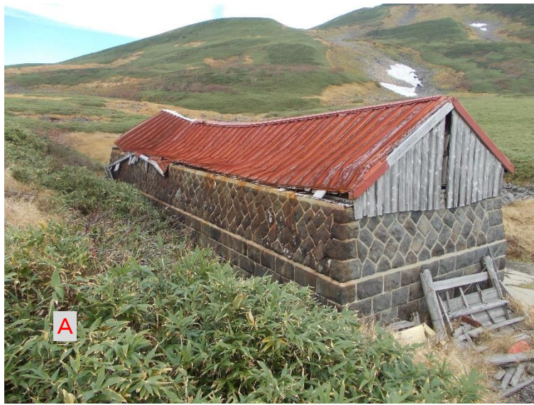
河原宿小屋現況写真