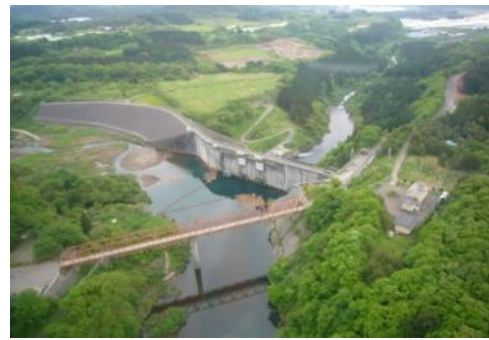
重力式コンクリートとロックフィルの複合構造