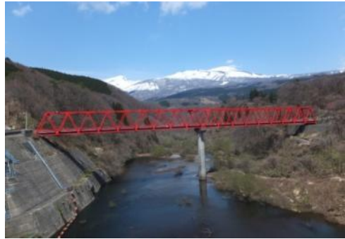
鳥海山と月光川大橋（ダムから撮影）