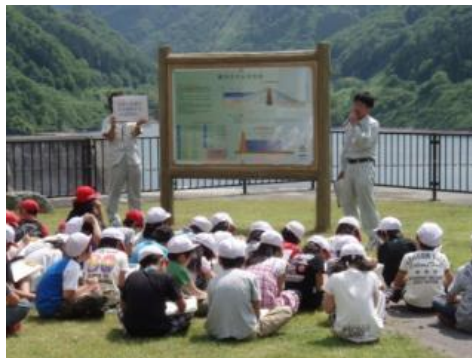
▲ダムの概要を説明