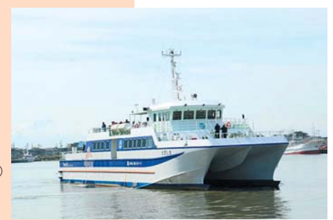
1 定期船とびしまフェリーターミナル