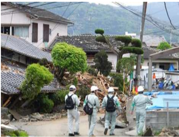
【写真：応急危険度判定活動（益城町）】

また、熊本市の場合、大量の判定士の移動が必要だったため、貸切バスを活用されていたが、決まった範囲に大量の判定士に乗り込んでもらう場合、非常に有効だったと感じました。