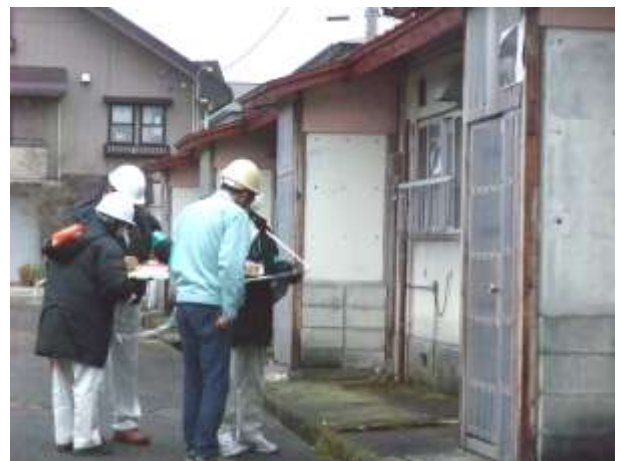
【写真：応急危険度判定模擬訓練状況】 (新庄市内 旧県営住宅)