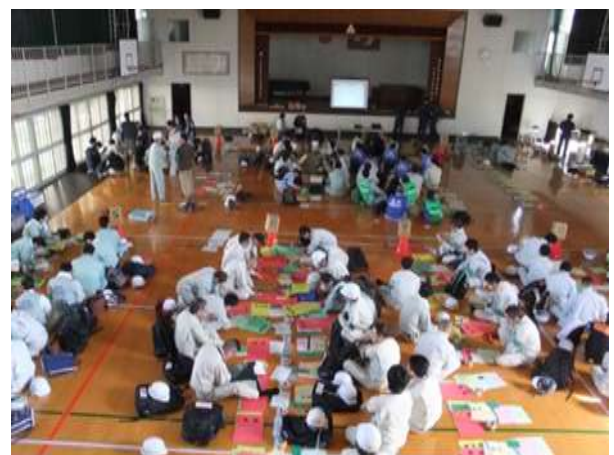
【写真：応急危険度判定拠点施設（県立盲学校体育館）】